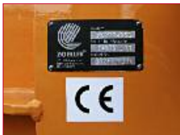
✓ Tablica proizvođača s traženim informacijama i odvojenom CE oznakom

Trajnim oznakama će biti naznačene maksimalne dozvoljene mase podizanja