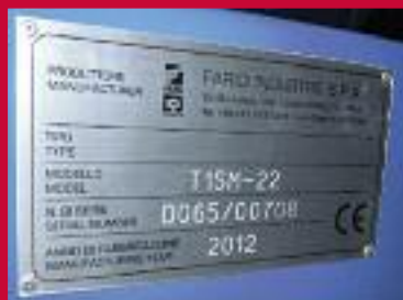
✓ Pločica proizvođača s traženim informacijama uključujući CE oznaku