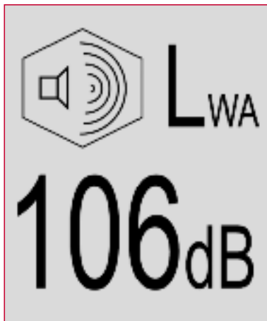
Oznaka koja pokazuje jamčenu razinu jačine zvuka

Sukladno Europskoj Direktivi 2000/14/EC ne postoji određena vrijednost za emisiju buke za RCV. No, svi RCV-i moraju imati oznaku jamčene razine jačine zvuka.