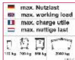
Primjer deklaracije s maksimalnim dozvoljenim težinama za podizanje